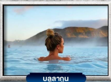
บลูลากูน