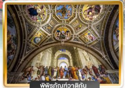
พิพิธภัณฑสถาน