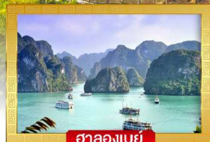
ฮาลองเบย์