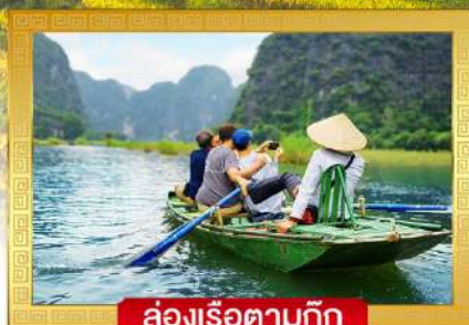
ล่องเรือตามก๊ก