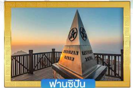
ฟานซีปัน