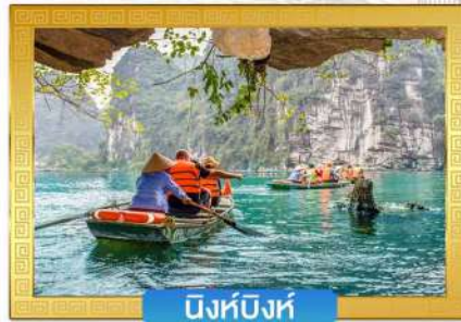
นิงห์บิงห์