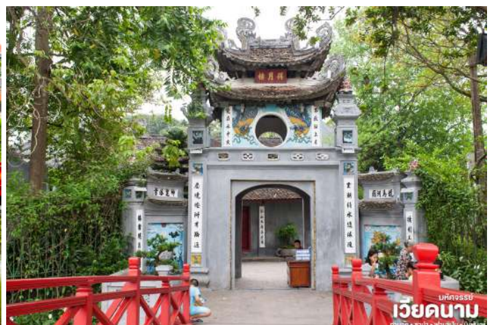
บทศรรย เวียดนาม ฮานอย • ฮาป้า • ฟานซิปป์ • นิงห์บิ่งห์

จากนั้น นำท่านชม สะพานแสงอาทิตย์ สีแดงสดใสสู่กลางทะเลสาบคินดาบ ชมวัดโบราณ วัดห็อกเชิน (ด้านนอก) สถานที่แห่งนี้มี เต่าสตัฟ ขนาดใหญ่ ซึ่งมีความเชื่อว่า เต่าตัวนี้ คือเต่าศักดิ์สิทธิ์ 1 ใน 2 ตัวที่อาศัยอยู่ในทะเลสาบแห่งนี้มาเป็นเวลานาน