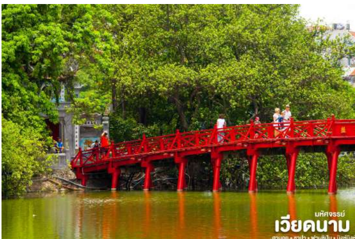
บทศรรย เวียดนาม ฮานอย • ฮาป้า • ฟานซิปป์ • นิงห์บิ่งห์