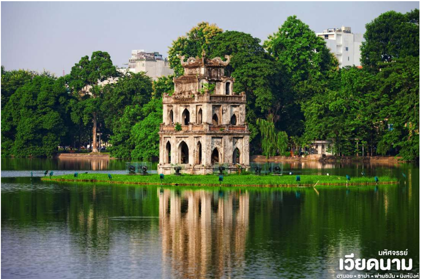
บทศรรย เวียดนาม ฮานอย • ฮาป้า • ฟานซิปป์ • นิงห์บิ่งห์