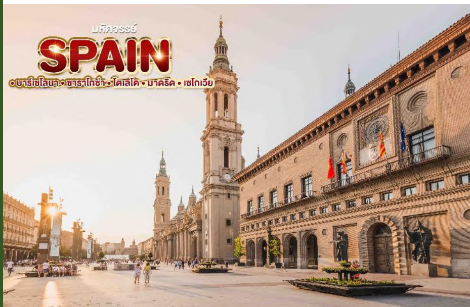
มหัศจรรย์ SPAIN •บาร์เซโลนา • ซาราโกซ่า • โตเลโด • มาดริด • เซโกเวีย

นำท่านเดินทางสู่ จัตุรัสพลาซา เดล พิลาร์ (Plaza Del Pilar) จัตุรัสคนเดินที่ใหญ่ที่สุดแห่งหนึ่งของสเปนอันเป็นศูนย์รวมของผู้คนในเมืองเมืองหลวงแห่งแคว้นอารากอนในประเทศสเปน ดินแดนแห่งสถาปัตยกรรมโรมัน บริเวณใกล้กันมี มหาวิหารของพระเยซูคริสต์ (La Seo de Zaragoza) เป็นโบสถ์โรมันคาทอลิกทรงคุณค่าตั้งอยู่ใจกลางเมืองซาราโกซ่า สร้างขึ้นระหว่างปี ค.ศ. 1380 และ 1550 เป็นสถาปัตยกรรมแบบผสมผสานระหว่างโกธิคบาโรก และมัวร์ได้อย่างลงตัว