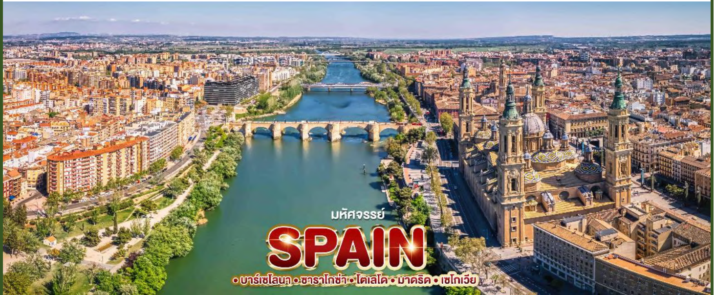
มหัศจรรย์ SPAIN •บาร์เซโลนา • ซาราโกซ่า • โตเลโด • มาดริด • เซโกเวีย