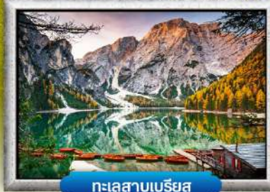
ทะเลสาบเบรียส