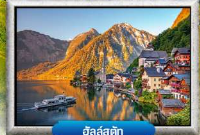
ฮัลล์สตีค