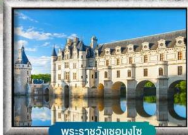
พระราชวังชองงโซ