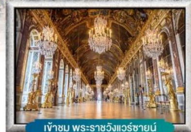
เข้าชม พระราชวังแวร์ซายน์