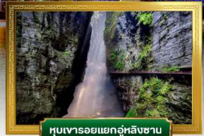
หุบเขารอยแยกอุ่หลิงซาน

เดินทางโดย: สายการบินโซนาเอ็กซ์เพรสแอร์ไลน์