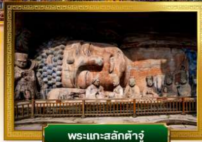
พระแกะสลักต้าจู่