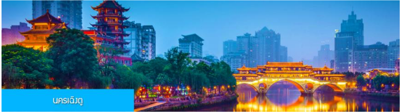
นครเฉิงตู