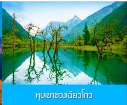
หุบเขาชวงเฉียวโกว