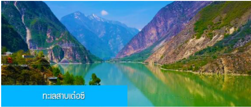
ทะเลสาบเต๋อซี