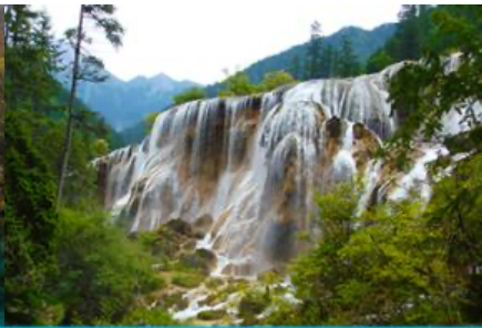
น้ำตกธารไข่มุก