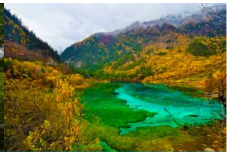
ทะเลสาบนกยูง (PEACOCK LAKE)

นำท่านชม ทะเลสาบแรด (RHINO LAKE) สูงจากระดับน้ำทะเล 2,301 เมตร น้ำลึกโดยเฉลี่ย 17 เมตร ยาวราว 2 กิโลเมตร เป็นทะเลสาบขนาดใหญ่ เสน่ห์อันน่าประทับใจของทะเลสาบนี้คือ หมอกเมฆและสายหมอกที่สะท้อนทะเลสาบแรดจนแยกไม่ออกกว่าส่วนไหนที่เป็นท้องฟ้า ความเปลี่ยนแปลงของทั้งเมฆและหมอกในทุกๆ เช้า ให้ความงดงามที่แตกต่างกันไปในแต่ละวันอย่างน่าประทับใจ นอกจากนี้ทะเลสาบแรดเป็นทะเลสาบเดียวที่อนุญาตให้นักท่องเที่ยวล่องเรือขอชมได้