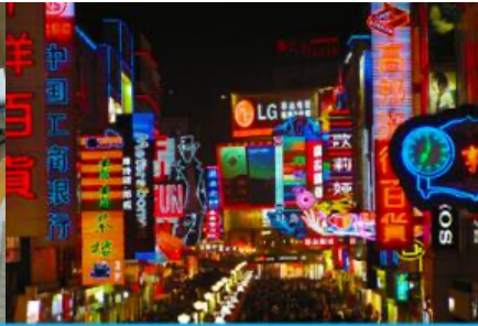
ถนนคนเดินซุนซีลู่