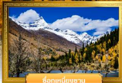
ชื่อกุ๋เหมียงซาน