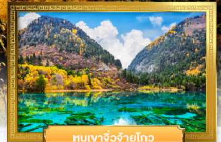
หุบเขาจิวจ้ายโกว