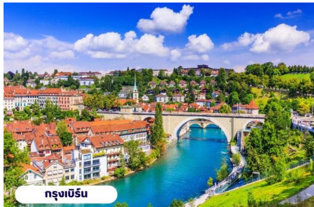
กรุงเบิร์น

เลาะชม ถนนจุงเคอร์นกาสเซ ถนนที่มีระดับสูงสุดของเมืองนี้ ซึ่งเต็มไปด้วยร้านภาพวาดและร้านขายของเก่าในอาคารโบราณ ชม นาฬิกาใช้ทศลือคเค่นทรม อายุ 800 ปี ที่มีโชว์ให้ดูทุกๆ ชั่วโมงในการตีบอกเวลาแต่ละครั้ง หอนาฬิกานี้ ในช่วงปี ค.ศ. 1191-1256 ใช้เป็นประตูเมืองแห่งแรก ภายหลังได้ตัดแปลงใช้ทศลือคเค่นทรมให้กลายเป็นหอนาฬิกา พร้อมติดตั้งนาฬิกาดาราศาสตร์เข้าไป จากนั้นอิสระให้ท่านเดินเล่นและเก็บภาพตามอัธยาศัยหรือจะเลือกซื้อปิ้งซื้อสินค้าแบรนด์เนมและซื้อของที่ระลึก