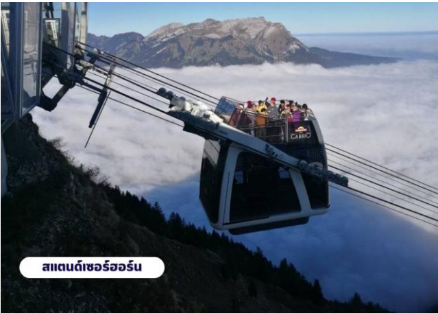
สแตนด์เซอร์ฮอร์น

☉ บริการอาหารกลางวัน ณ ภัตตาคาร จากนั้นนำท่านลงจากยอดเขาและเดินทางต่อไป