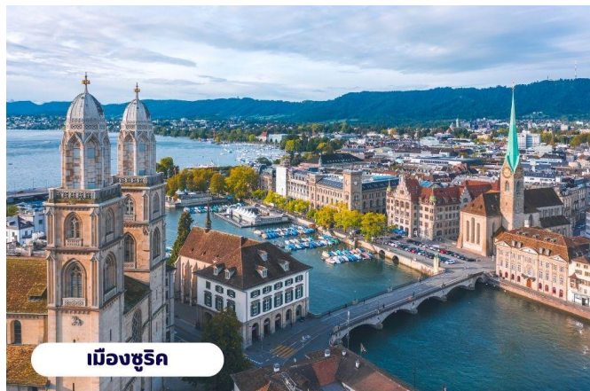
เมืองซูริก

ยัง เมืองซูริก ใช้เวลาเดินทางประมาณ 1 ชั่วโมง นำท่านเที่ยวชม จัตุรัสพาราเดพลาทซ์ (Paradeplatz) จัตุรัสเก่าแก่ที่มีมาตั้งแต่สมัยศตวรรษที่ 17 ในอดีตเคยเป็นศูนย์กลางของการค้าสัตว์ที่สำคัญของเมืองซูริก ปัจจุบันจัตุรัสนี้ได้กลายเป็นชุมทางรถรางที่สำคัญของ