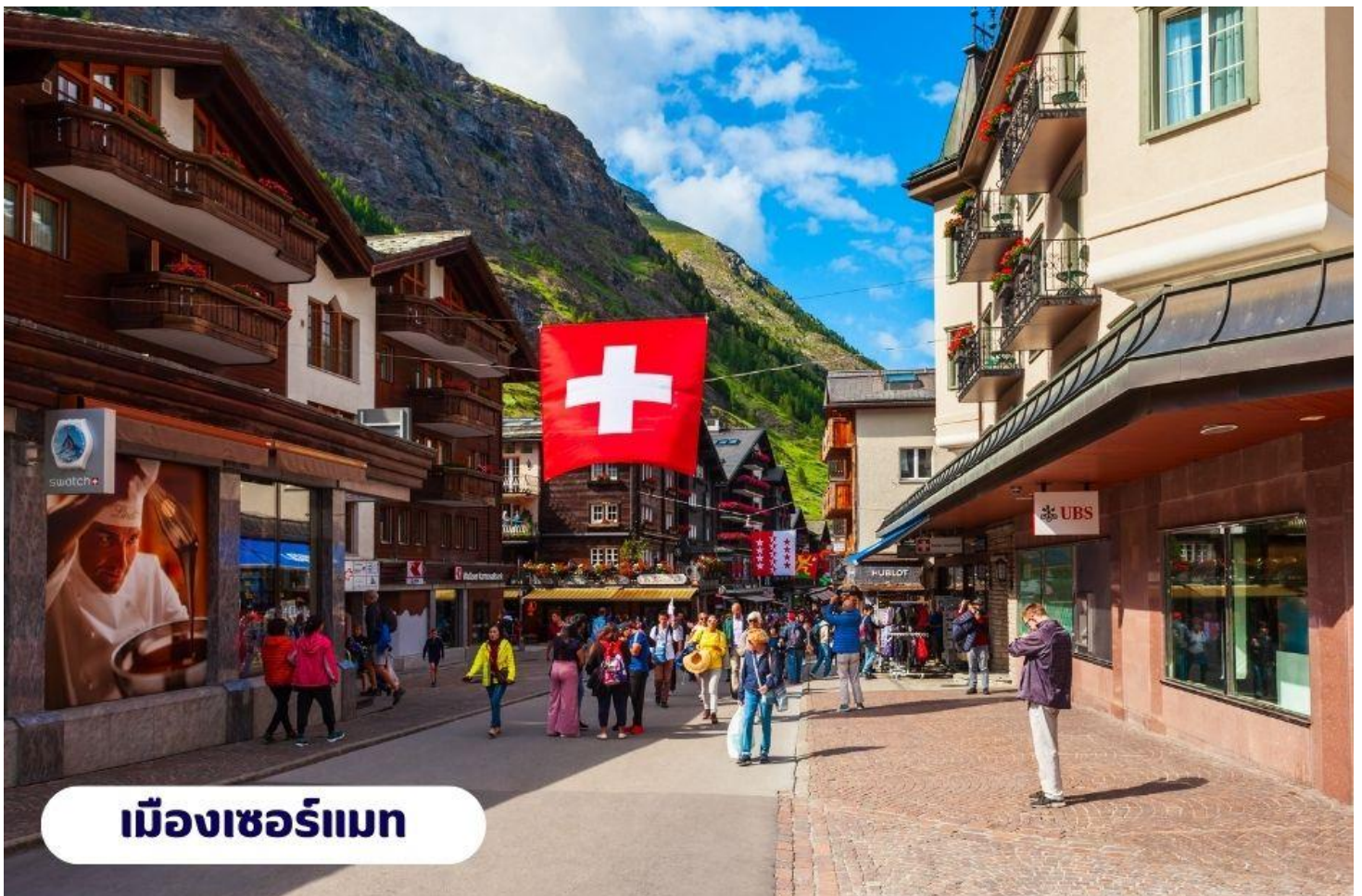
เมืองเซอร์แมท

🕒 บริการอาหารเช้า ณ ห้องอาหารของโรงแรม จากนั้นนำท่านเดินทางสู่ เมืองแทสซ์ (Tasch) ใช้เวลาเดินทางประมาณ 2.30 ชั่วโมง ตั้งอยู่ในประเทศสวิตเซอร์แลนด์ เป็นประเทศขนาดเล็กที่ไม่มีทางออกสู่ทะเล และตั้งอยู่ในทวีปยุโรปตะวันตก ซึ่งมีเทือกเขาแอลป์ ซึ่งเป็นเทือกเขาที่ใหญ่ที่สุดของทวีปยุโรป เลาะเลียบบตามหุบเขา ชมทิวทัศน์สวยอันงดงาม ตลอดเส้นทาง จากนั้นนำท่านเดินทางโดยรถไฟสู่เมืองเซอร์แมท (Zermatt) ใช้เวลาเดินทางประมาณ 15 นาที โดยรถไฟซึ่งเป็นเมืองที่ไม่อนุญาตให้รถยนต์วิ่งและเป็นเมืองที่ได้รับการยกย่องว่า ปลอดภัยที่สุดในโลกตั้งอยู่บนความสูงกว่า 1,620 เมตร ซึ่งเป็นที่ตั้งของยอดเขาแมทเทอร์ฮอร์น ซึ่งเป็นสัญลักษณ์ของสวิตเซอร์แลนด์ เมืองเซอร์แมทเป็นเมืองเล็กๆ หรืออาจจะเรียกได้ว่าเป็นหมู่บ้านก็ได้ เพราะว่ามีประชากรในเมืองไม่ถึง 10,000 คน ทางตอนใต้ของสวิตติดกับชายแดนอิตาลี โดยมี Pennine Alps ซึ่งเป็นส่วนหนึ่งของเทือกเขา Alps เป็นเส้นกั้นระหว่าง 2 ประเทศหากพูดถึง Zermatt ก็ต้องนึกถึงยอดเขาแหลมที่มีลักษณะคล้ายปิรามิด ชื่อว่า Matterhorn ที่ตั้งตระหง่านอยู่ใกล้ๆ เมือง มีความสูงถึง 4,478 เมตร สามารถมองเห็นได้จากแทบทุกมุมของเมือง ซึ่ง Matterhorn นี้ถือเป็นสัญลักษณ์ที่สำคัญของ Zermatt