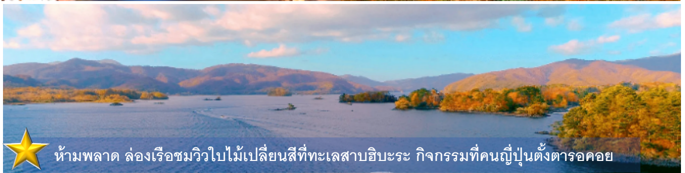
ห้ามพลาด ล่องเรือชมวิวยามใบไม้เปลี่ยนสีที่ทะเลสาบฮิโระ กิจกรรมที่คนญี่ปุ่นตั้งตารอคอย