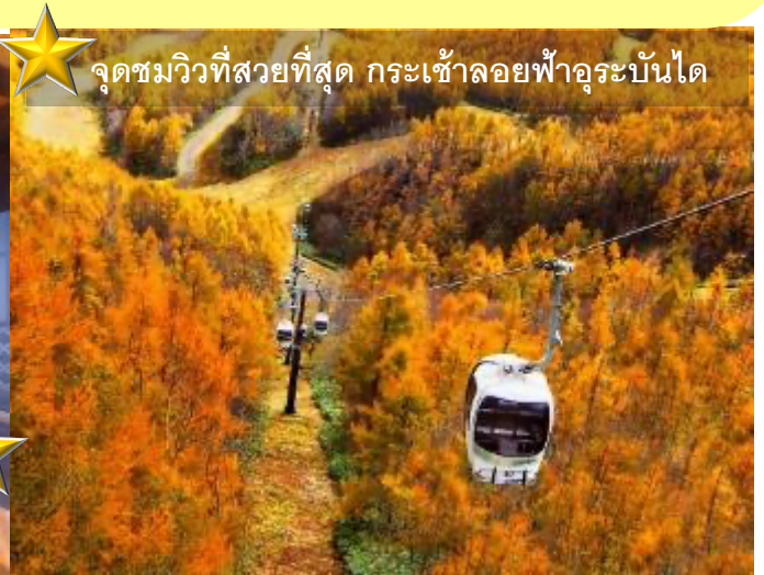
จุดชมวิวที่สวยงามที่สุด กระเช้าลอยฟ้าอุระบันได