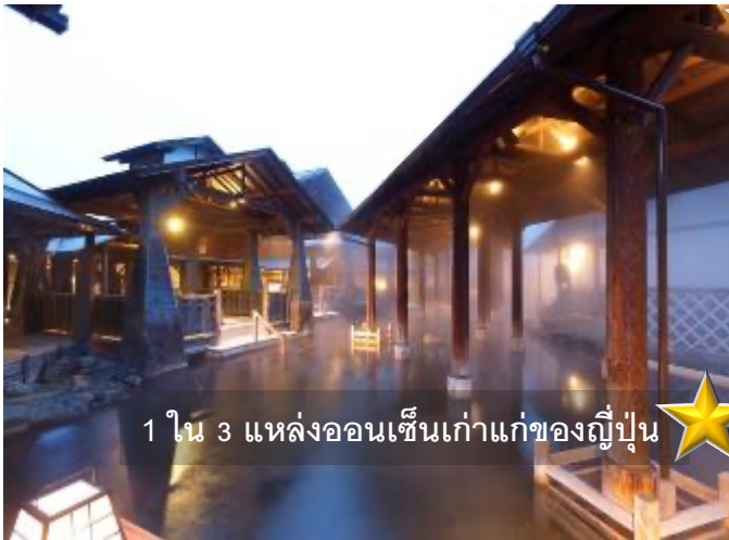
1 ใน 3 แหล่งออนเซ็นเก่าแก่ของญี่ปุ่น