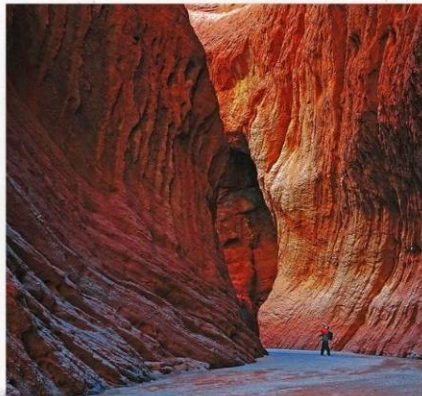
แกรนด์แคนยอน เทียนซาน