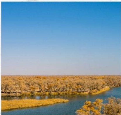
สวนต้นหุหยาง