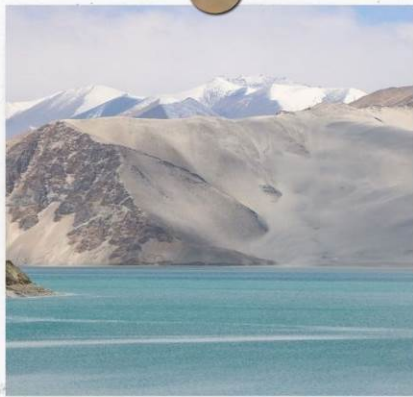
ทะเลสาบไ้ซาหุ