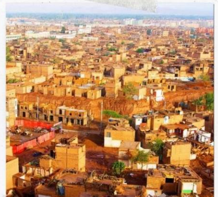
เมืองคาสือ