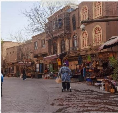
เมืองไบรานคัซการ์