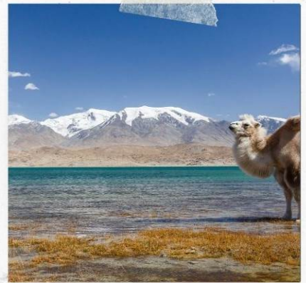
ทะเลสาบคาลาคูเล่อ