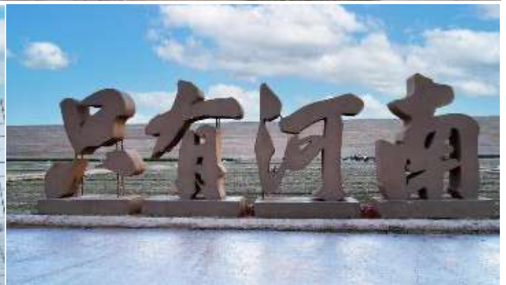
ตัวนำมหัศจรรย์ยิ่งนัก