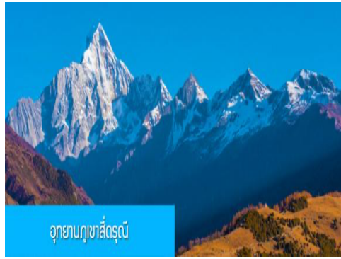
อุทยานภูเขาสี่ดรุณี

เที่ยง รับประทานอาหารกลางวัน ณ ภัตตาคาร หลังอาหารนำท่านเที่ยวชม หุบเขาชวงเฉียวโกว 双桥沟景区 ที่เป็นแหล่งท่องเที่ยวที่สวยงามที่สุดแห่งหนึ่งในเขตอุทยานภูเขาสี่ดรุณี นำท่านนั่งรถบั๊สของอุทยานที่วิ่งไปผ่านเส้นทางที่สร้างคู่ขนานกับลำธารกษยในหุบเขา ท่านจะได้สัมผัสกับความสวยงามของทัศนียภาพธรรมชาติที่หาชมได้ยาก โดยมีภูเขาหิมะสูงตระหง่านอยู่เบื้องหลัง ธารน้ำใสไหลริน และสระน้ำที่มีสีเขียวมรกต ในฤดูใบไม้ผลิและฤดูร้อนท่านจะได้เห็นฝูงจามรีท่ามกลางทุ่งหญ้าเขียวขจี ส่วนในฤดูหนาวทุ่งหญ้าและพื้นดินจะปกคลุมด้วยพรมหิมะสีขาว....รถบั๊สของอุทยานจะนำนักท่องเที่ยวไปยังจุดชมวิิวสำคัญต่าง ๆ ภายในเขตอุทยาน เพื่อให้ให้นักท่องเที่ยวได้เที่ยวชมสถานที่และถ่ายรูปตามอัธยาศัย จนครบแ่เวลา นำคณะขึ้นรถบั๊สออกจากอุทยาน