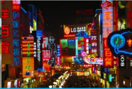
ถนนคนเดินซุนซีลู่