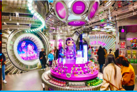
ร้าน POP MART