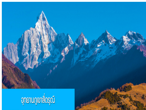
อุทยานภูเขาสี่ครุณี

หลังอาหารเช้าท่านเที่ยวชม หุบเขาชวงเฉียวโกว 双桥沟景区 ที่เป็นแหล่งท่องเที่ยวที่สวยงามที่สุดแห่งหนึ่งในเขตอุทยานภูเขาสี่ครุณี นำท่านนั่งรถบัสของอุทยานที่วิ่งไปผ่านเส้นทางที่สร้างคู่ขนานกับลำธารภสยในหุบเขา ท่านจะได้สัมผัสกับความสวยงามของทัศนียภาพธรรมชาติที่หาชมได้ยาก โดยมีภูเขาหิมะสูงตระหง่านอยู่เบื้องหลัง ธารน้ำใสไหลริน และสระน้ำที่มีสีเขียวมรกต ในฤดูใบไม้ผลิและฤดูร้อนท่านจะได้เห็นฝูงจามรีท่ามกลางทุ่งหญ้าเขียวขจี ส่วนในฤดูหนาวทุ่งหญ้าและพื้นดินจะปกคลุมด้วยพรมหิมะสีขาว....รถบัสของอุทยานจะนำนักท่องเที่ยวไปยังจุดชมวิวสำคัญต่าง ๆ ภายในเขตอุทยาน เพื่อให้นักท่องเที่ยวได้เที่ยวชมสถานที่และถ่ายภาพตามอัธยาศัย จนครบแ่เวลา นำคณะขึ้นรถบัสออกจากอุทยาน