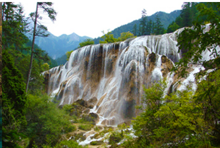
น้ำตกธารไข่มุก