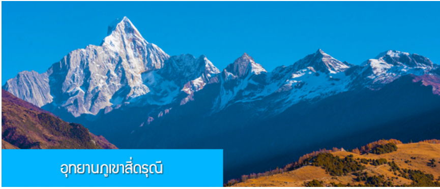
อุทยานภูเขาสี่ครุณี