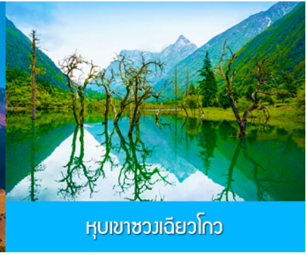
หุบเขาชวงเฉียวโกว