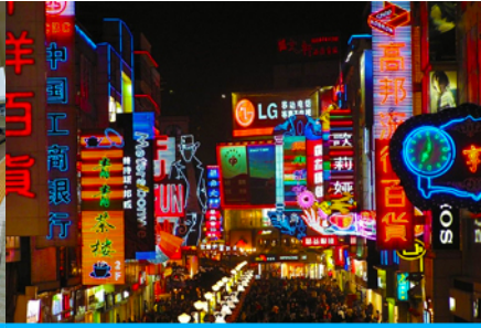
ถนนคนเดินซุนซีลู่