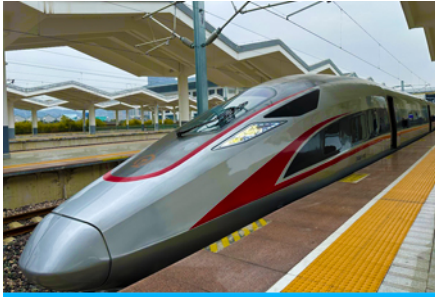
บั้งรถไฟความเร็วสูง