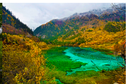
ทะเลสาบนกยูง (PEACOCK LAKE)

นำท่านชม ทะเลสาบแรด (RHINO LAKE) สูงจากระดับน้ำทะเล 2,301 เมตร น้ำลึกโดยเฉลี่ย 17 เมตร ขาวราว 2 กิโลเมตร เป็นทะเลสาบขนาดใหญ่ เสน่ห์อันน่าประทับใจของทะเลสาบนี้คือ หมู่แมกและสายหมอกที่สะท้อนทะเลสาบแรดจนแยกไม่ออกว่าส่วนไหนที่เป็นท้องฟ้า ความเปลี่ยนแปลงของทั้งเมฆและหมอกในทุกๆ เข้า ให้