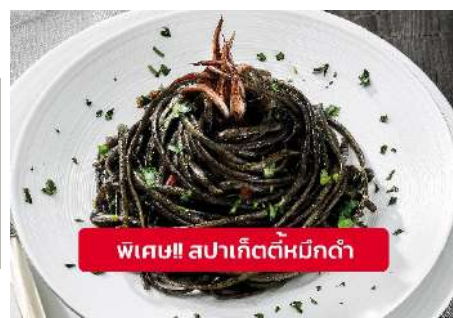
พิเศษ!! สปาเก็ตตี้หมึกดำ

Highlight ! เมื่อเยือนเกาะเวนิส เมนูที่ขึ้นชื่อและหากได้มาต้องได้ลิ้มลอง สปาเก็ตตี้พืดซอสหมึกดำที่คลุกเคล้ากับความหอม กับ บรรยากาศสุดคลาสสิคฉบับอิตาเลียนตำรับเวนิส