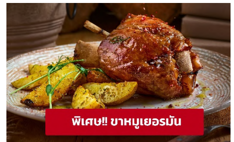
พิเศษ!! ขาหมูเยอรมัน

เย็น ๑๑ รับประทานอาหารเย็น (มื้อที่4) ที่พัก : Hotel Goldenes Schiff หรือโรงแรมระดับใกล้เคียงกัน (ชื่อโรงแรมที่ท่านพัก ทางบริษัทจะทำการแจ้งพร้อมใบนัดหมาย 5-7 วัน ก่อนวันเดินทาง)