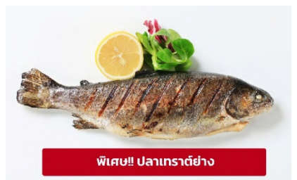
พิเศษ!! ปลาเทราต์ย่าง

เที่ยง ๑๐ รับประทานอาหารเที่ยง (เนื้อที่6) เมนูพิเศษ ปลาเทราต์ย่างท่านละ 1 ตัว นำท่านเดินทางสู่ เมืองมรดกโลกเชสกี ครุมลอฟ (Cesky Krumlov) สาธารณรัฐเช็ก (ระยะทาง 210 กม./ 3.30 ชม.) ล้อมรอบด้วยแม่น้ำ Vltava ทำให้เมืองแห่งนี้มีลักษณะคล้ายหยดน้ำ จนถูกขนานนามว่าเป็น "เมืองหยดน้ำ" จากนั้นนำท่านถ่ายรูปบริเวณรอบนอก ปราสาทครุมลอฟ (Cesky Krumlov Castle) เป็นปราสาทกอธิคดั้งเดิม ตั้งอยู่ริมฝั่งแม่น้ำวัลตาวาบนแหลมหิน มีหอคอยสี่มุมพวยหวนๆ ราวกับปราสาทเจ้าหญิงในนิยาย มีอายุกว่า 700 ปี เคยเป็นคฤหาสน์ส่วนตัวของขุนนางถึง 3 ตระกูล ก่อนจะตกเป็นสมบัติของรัฐบาล