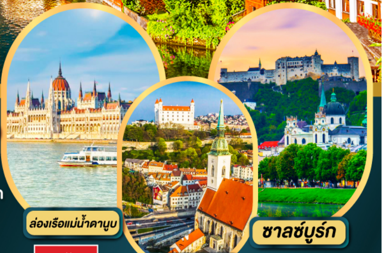
ล่องเรือแม่น้ำดานูบ