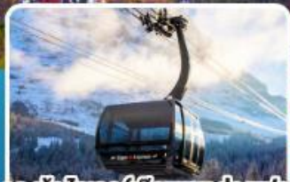
กระเช้าไอเกอร์เอ็กซ์เพรส สู่จุงเฟรา

อิตาลี สวิตเซอร์แลนด์ ฝรั่งเศส 10 วัน 7 คืน