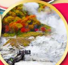
หุบเขานรกจิโกกุคานิ