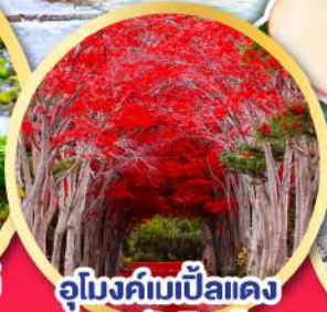
อุโมงค์ไม้แป้นแดง ณ สวนลับฮิราโอกะ