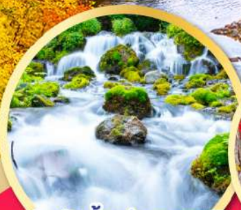
สัมผัสน้ำแร่ธรรมชาติ ณ สวนฟุกิดาชิ