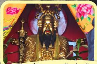
• เอียงบู๊ซัว (ศาลเจ้าพ่อเสือ)