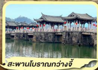
• สะพานโบราณกว่างจี้