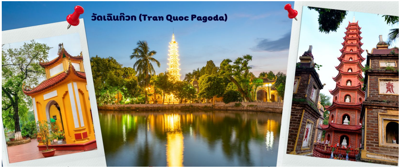
วัดเจดีย์กว (Tran Quoc Pagoda)

ที่ตั้ง ที่นี้เหมือนตั้งอยู่บนเกาะที่ยื่นลงไปในทะเลสาบ แต่มีเส้นทางคมนาคมเข้าถึงที่ สิ่งปลูกสร้างมีการวางผังเป็นอย่างดี ใช้สีสันทึกลมกลืนในโทนสีเหลือง น้ำตาล ตัดกับสีเขียวของต้นไม้ใหญ่ที่โอบล้อมอยู่ในมุมถ่ายภาพจากอีกฝั่งหนึ่ง จะเห็นสิ่งปลูกสร้างสไตล์จีน และเจดีย์หลายชั้นโดดเด่น มีภาพที่สะท้อนลงสู่ผิวน้ำ เป็นภูมิทัศน์ที่งดงามทั้งยามกลางวันและยามค่ำคืนที่มีการเปิดไฟส่องสว่าง