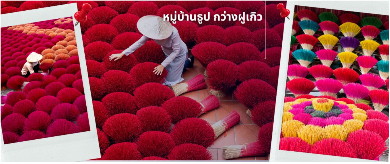
สลับซับซ้อนราวกับภาพสามมิติ

เหมือนทุ่งดอกไม้ใกล้กรุงसानอย ชาวบ้านที่ส่งต่อ และถ่ายทอดวิธีการทำรูปแบบดั้งเดิม ทั้งการเหลาไม้ไผ่ ย้อมสี ตากแดด และมีลักษณะคล้ายพุ่มไม้ หรือ ดอกไม้ เอกลักษณะนี้ถูกพัฒนาและต่อยอด จัดแต่งรูปให้ เป็นคล้ายสวน ดึงดูดนักท่องเที่ยวให้ไปเยี่ยมชม เรียกได้ว่า เป็นแลนด์มาร์คใหม่ของนักท่องเที่ยวเลยทีเดียว