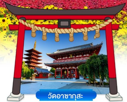
วัดอาซากุสะ