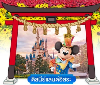
ดิสนีย์แลนด์อิสระ