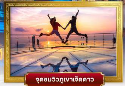
จุดชมวิวกูภูเขาเจ็ดดาว