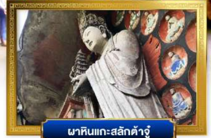
พาหีนแกะสลักต้าจู้