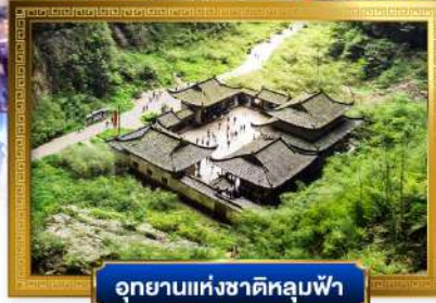
อุทยานแห่งชาติหลุมฟ้า