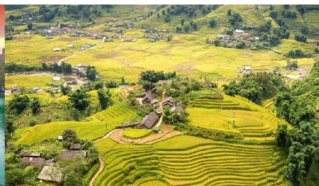
หมู่บ้านต้าฟาน

*กรณีห้องพักรับรองเปลี่ยน ขอสงวนสิทธิ์ในการเปลี่ยนวันเข้าพัก และปรับเปลี่ยนโปรแกรมโดยคำนึงถึงผลประโยชน์ลูกค้าเป็นสำคัญ