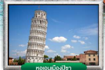
หอเอนเมืองปิซา

พิเศษ! สปาเกตตีเส้นหมึกดำ, พิชซ่าสไตล์อิตาลีเยี่ยมแท้