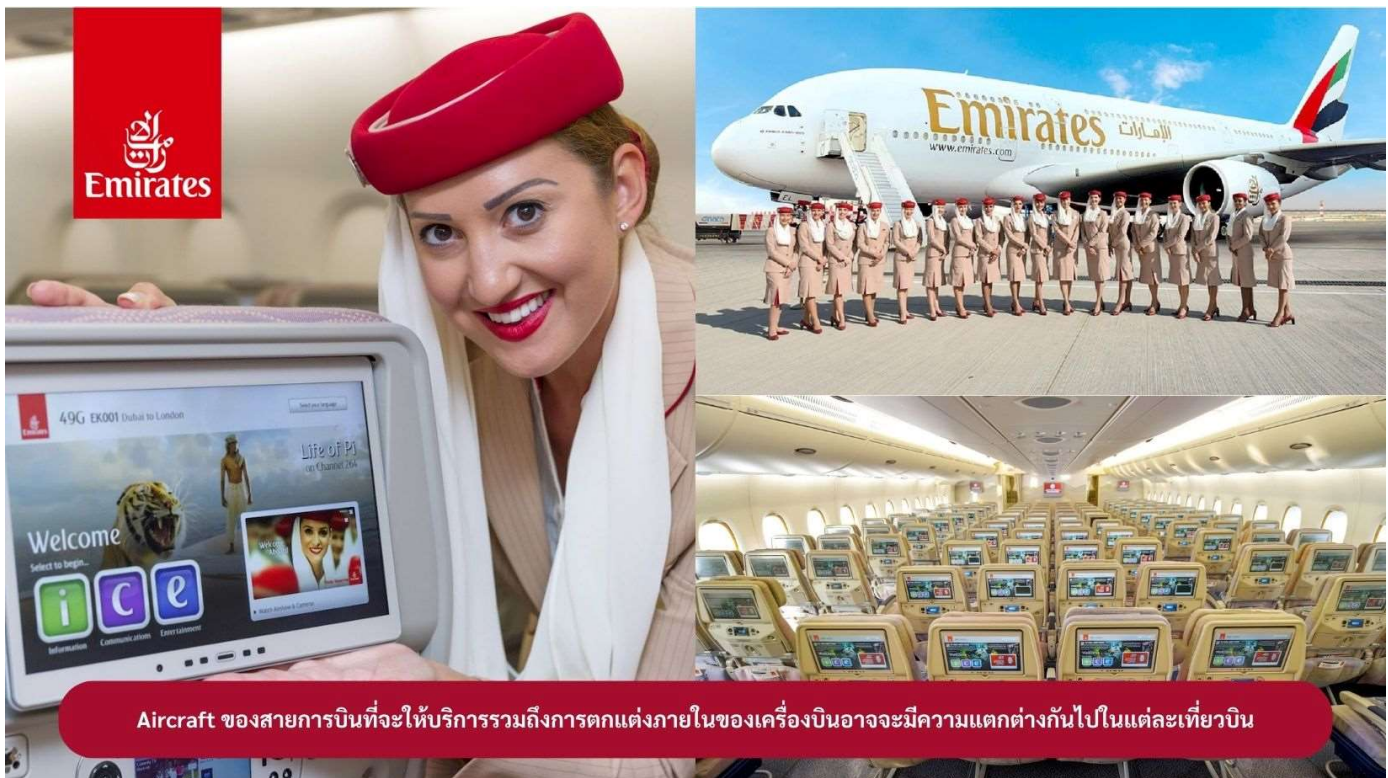
Aircraft ของสายการบินที่จะให้บริการรวมถึงการตกแต่งภายในของเครื่องบินอาจจะมีความแตกต่างกันไปในแต่ละเที่ยวบิน

23.00 น. 🛫 คณะเดินทางพร้อมกัน ณ สนามบินสุวรรณภูมิ อาคารผู้โดยสารขาออก ระหว่างประเทศ ชั้น 4 ประตู 9 แถว T สายการบินเอมิเรตส์ แอร์ไลน์ (EK) เจ้าหน้าที่ให้การต้อนรับและอำนวยความสะดวก