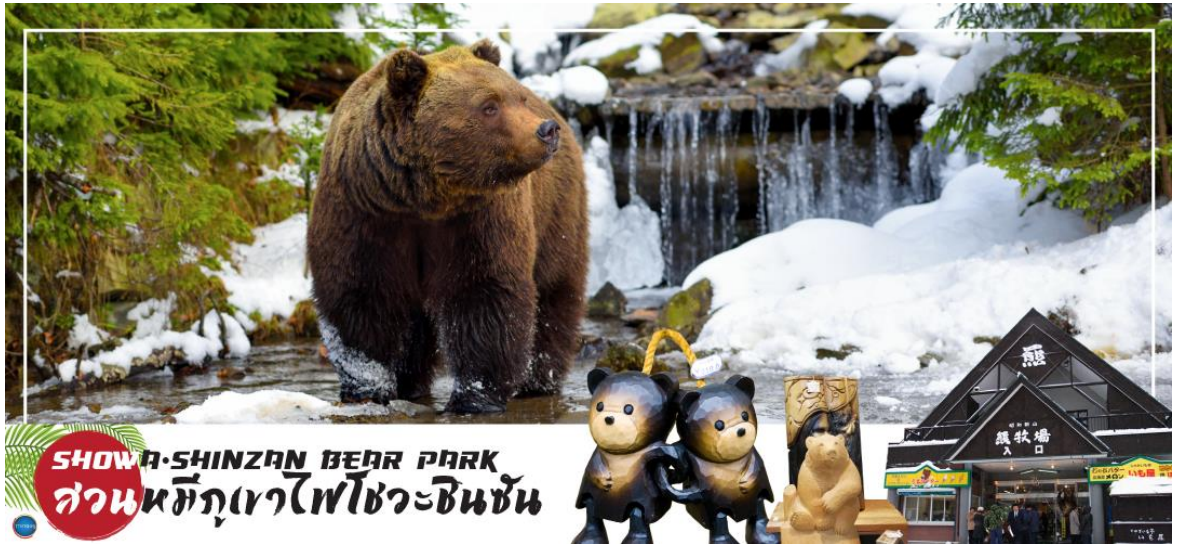
SHOWA-SHINZAN BEAR PARK สวนหมีภูเขาไฟโชวะชินซัน

นำท่านสู่ หุบเขารกจิโกกุดานิ Jigokudani หรือ Hell Valley (ใช้เวลาเดินทางประมาณ 1 ชั่วโมง) เป็นหุบเขาที่งดงาม น้ำร้อนในลำธารของหุบเขาแห่งนี้มีแร่ธาตุกำมะถันซึ่งเป็นแหล่งต้นน้ำของยานบ่อน้ำร้อนโนโบริเบทสึนั่นเอง เส้นทางตามหุบเขาสามารถเดินได้ขึ้นเนินไปเรื่อยๆประมาณ 20 -30 นาที จะพบกับบ่อโอยูนูมะ (Oyunuma) เป็นบ่อน้ำร้อนกำมะถัน อุณหภูมิ 50 องศาเซลเซียส ถัดไปเรื่อยๆ ก็จะเป็นบ่อเล็กๆ บางบ่อมีอุณหภูมิที่ร้อนกว่า และยังมีบ่อโคลนอีกด้วย น้ำที่ไหลออกจากบ่อโอยูนูมะ เป็นลำธารเรียกว่า โอยูนูมะกาวา (Oyunumagawa) สามารถเพลิดเพลินไปกับการแช่เท้าพร้อมชมทิวทัศน์ที่งดงามนี้ได้รับการขึ้นทะเบียนเป็นมรดกโลกทางวัฒนธรรมในปี 1994 จากองค์การยูเนสโก ในฐานะส่วนหนึ่งของอนุสาวรีย์ทางประวัติศาสตร์เมืองเกียวโต