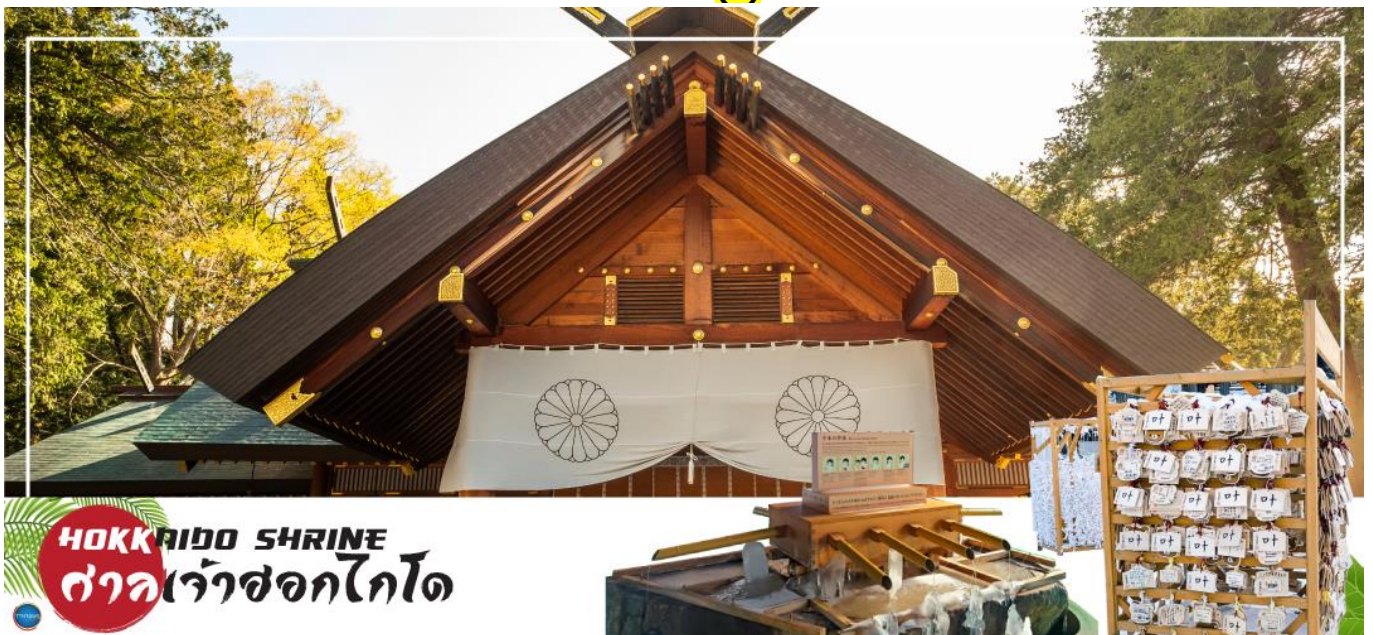
HOKKAIDO SHRINE ศาลเจ้าซอกไกโด

จากนั้นนำท่านเดินทางสู่ เมืองซัปโปโร (SAPPORO) (ใช้เวลาเดินทางประมาณ 1.20 ชั่วโมง) นำท่านขอพร ศาลเจ้าซอกไกโด (Hokkaido Shrine) หรือเดิมชื่อ ศาลเจ้าซัปโปโร เปลี่ยนเพื่อให้สมกับ ความยิ่งใหญ่ของเกาะเมืองซอกไกโด ศาลเจ้าชินโตนี้คอยปกป้องรักษา ให้ชนชาวเกาะซอกไกโดมีความสุขถึงแม้จะไม่ได้มีประวัติศาสตร์อันยาวนาน