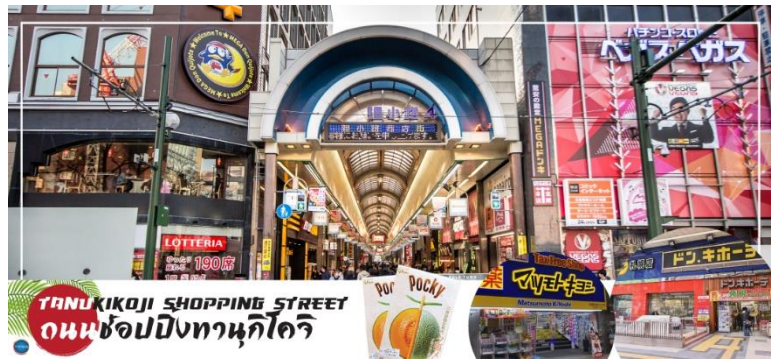
TANUKIKOJI SHOPPING STREET ถนนช้อปปิ้งทานุกิโคจิ

จากนั้นนำท่านสู่ ถนนช้อปปิ้งทานุกิโคจิ (Tanukikoji Shopping Street) เป็นย่านการค้าเก่าแก่ของเมืองซัปโปโร โดยมีพื้นที่ทั้งหมด 7 บล็อก ภายในนอกจากจะเป็นแหล่ง รวมร้านค้าต่างๆ อย่างร้านขายกิโมโน เครื่องดนตรี วิดีโอ โรงภาพยนตร์ แล้ว ยังมีร้านอาหารมากมาย ทั้งยังเป็นศูนย์รวมของเหล่าวัยรุ่นด้วย เนื่องจากมีเกมเซินเตอร์และตู้หนีบตุ๊กตามากมาย ร้านดองกิ ร้าน 100 เยน นอกจากนั้นที่นี่ยังมีการตกแต่งบนหลังคาด้วยตุ๊กตาทานุกิขนาดใหญ่ และเนื่องจากร้านค้าส่วนใหญ่มีหลังคาคลุม ดังนั้น ไม่ต้องกังวลเรื่อง ฝนหรือหิมะ ท่านสามารถช้อปปิ้งได้อย่างเพลิดเพลิน