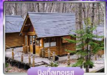
นิงเกิ้ลเทอเรซ