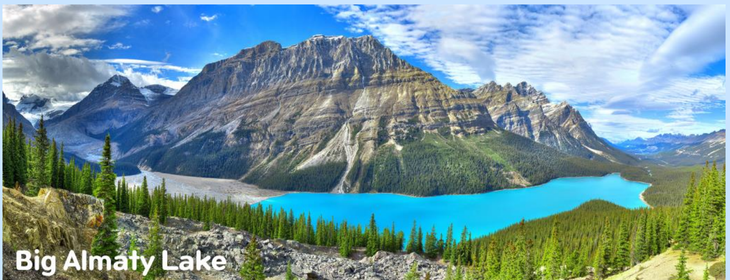
Big Almaty Lake

เช้า รับประทานอาหารเช้า ณ ห้องอาหารโรงแรม