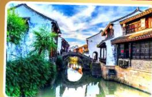
เมืองโบราณฮี้เหอ