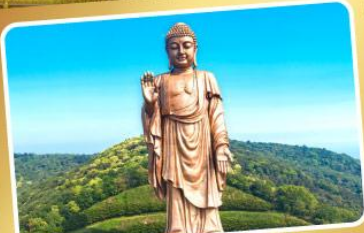
พระใหญ่หลังซานต้าฝอ