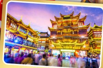
ตลาดร้อยปีเจิ้งหวงเมี่ยว