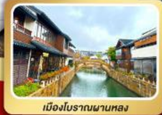
เมืองโบราณผานหลง