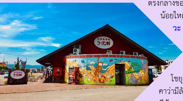
แบบเฉพาะของที่นี่

ตรงกลางของเกาะฮอกไกโด เป็นเมืองใหญ่รองจากซัปโปโร ล้อมรอบด้วยเทือกเขาไคเซ็ทสึซันและแม่น้ำน้อยใหญ่ มีธรรมชาติสวยๆ ให้ดูได้ตลอด 4 ฤดู จากนั้นนำท่านเดินทางสู่ หมู่บ้านราเม็งอาซาฮิคาวะ ถือกำเนิดขึ้นในปี 1996 โดยรวบรวมร้านราเม็งชื่อดังของเมืองอาซาฮิคาว่าทั้ง 8 ร้านมาอยู่รวมกันเป็นอาคารหลังคาเดียว เสมือนหมู่บ้านราเม็งที่รวบรวมร้านดังไว้ในที่เดียว อาซาฮิคาว่า เป็นเมืองที่มีชื่อเสียงในเรื่องของโซยุราเม็ง ซึ่งอาซาฮิคาว่ายังติดอันดับ 1 ใน 3 ราเม็งฮอกไกโดที่มีชื่อเสียง อันได้แก่ มิโสะราเม็งของซัปโปโร, ชิโอะ (เกลือ) ราเม็งของฮาโกดาเตะ, โซยุราเม็งของอาซาฮิคาว่า โดยโซยุราเม็งของอาซาฮิคาว่ามีลักษณะเด่นที่น้ำซุบที่เข้มข้นอร่อย เพราะทำน้ำซุบจากซีฟู้ด, กระดูกหมูและกระดูกไก่ผสมกัน ผสานกับเส้นใน