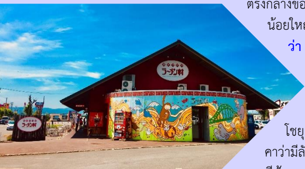
แบบเฉพาะของที่นี่

ว่า ถือกำเนิดขึ้นในปี 1996 โดยรวบรวมร้านราเม็งชื่อดังของเมืองอาซาฮิคาว่าทั้ง 8 ร้านมาอยู่รวมกันเป็นอาคารหลังคาเดียว เสมือนหมู่บ้านราเม็งที่รวบรวมร้านดังไว้ในที่เดียว อาซาฮิคาว่า เป็นเมืองที่มีชื่อเสียงในเรื่องของโซยุราเม็ง ซึ่งอาซาฮิคาเวะยังติดอันดับ 1 ใน 3 ราเม็งฮอกไกโดที่มีชื่อเสียง อันได้แก่ มิโสะราเม็งของซัปโปโร, ซีโอะ (เกลือ) ราเม็งของฮาโกดาเตะ, โซยุราเม็งของอาซาฮิคาว่า โดยโซยุราเม็งของอาซาฮิคาว่ามีลักษณะเด่นที่น้ำซุบที่เข้มข้นอร่อย เพราะทำน้ำซุบจากซีฟู้ด, กระดูกหมูและกระดูกไก่ผสมกัน ผสานกับเส้นใน