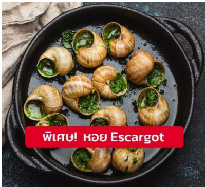
พิเศษ! หอย Escargot

เย็น ๑๐ รับประทานอาหารเย็น (มื้อที่13) เมนูพิเศษ!! หอย Escargot