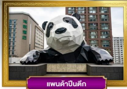
แพนด้าปิ่นตึก