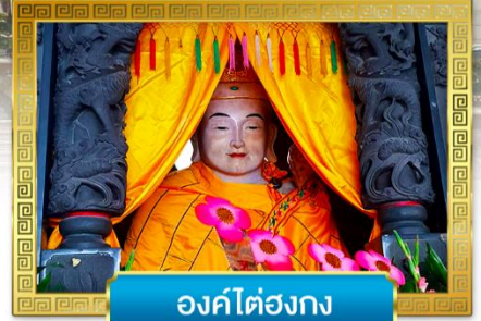
องค์ไต๋องกง