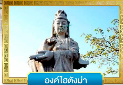
องค์ไฮตังม่า