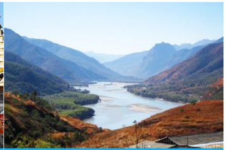
โค้งแรกแม่น้ำเยวซี

วันที่สอง เมืองฉู่สง-เมืองโบราณต้าหลี่ -วัดเจ้าแม่กวนอิม -ผ่านชมโค้งแรกแม่น้ำเยวซีเกียง-เมืองจงเตียน -เมืองโบราณแซงการีล่า