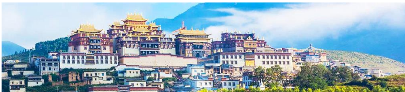
เมืองโบราณเซวกริล่า