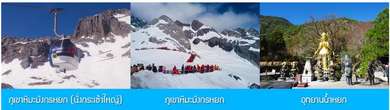
ภูเขาหิมะมังกรหยก (บันไดกระเช้าใหญ่)

ที่พัก FENG HUANG HOTEL ระดับ 4 ดาว หรือเทียบเท่าเมืองลี่เจียง