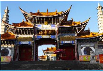
วัดเจ้าแม่กวนอิมเปลงกาย