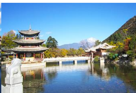
สะพานมังกรดำ