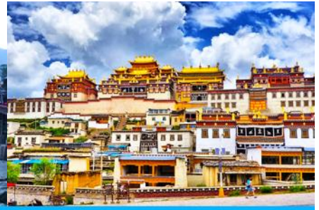
เมืองแซงการีล่า

วันที่สอง เมืองคุนหมิง-นั่งรถไฟความเร็วสูงสู่เมืองต้าหลี่-ช่องแคบเลื่อกระโจน-จงเตี้ยน-เมืองโบราณแซงการีล่า