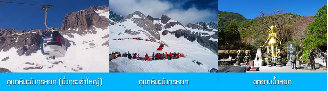
ภูเขาหิมะมังกรหยก (นั่งกระเช้าใหญ่)