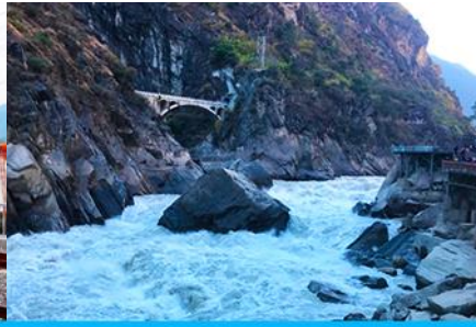
ช่องแคบเลื่อกระโจน