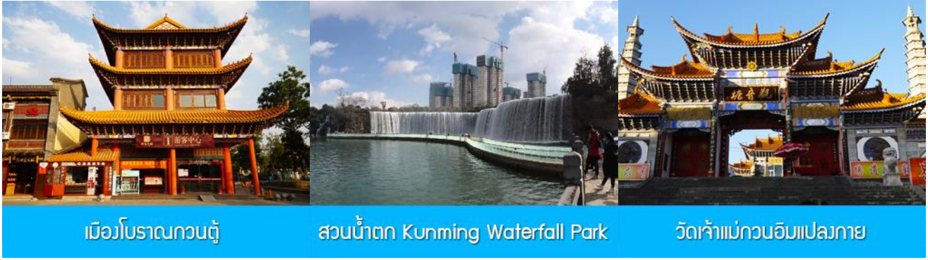
เมืองโบราณกวนตุ๋