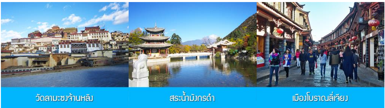
วัดลามะชวงจ้านหลิง

ที่ พัก YUE GUANG HOTEL ระดับ 4 ดาว หรือเทียบเท่าเมืองจางเจี้ยน หรือเซกรี่ล่า