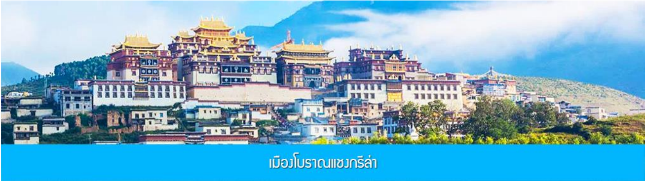
เมืองโบราณเซกรี่ล่า

หมายเหตุ การเที่ยวชมอุทยานช่องแคบเสือกระโจน สามารถเที่ยวได้ด้วยการบินลง และขึ้นบันไดจากบริเวณลานจอดรถลงไปยังจุดชมวิวยุริมน้ำที่อยู่ด้านล่าง (บันไดราว 430 ขั้น) หรือท่านสามารถซื้อตั๋วบันไดเลื่อนในราคา 70-100 หยวนรวมขาลงและขาขึ้น ( โดยราคา 70 หยวนจะมีเฉพาะช่วงที่มีโปรแกรมขึ้นเท่านั้น) ค่าทัวร์ของเราได้รวมค่าเข้าชมอุทยานเสือกระโจน แต่ยังไม่รวมค่าบันไดเลื่อน หากท่านต้องการซื้อตั๋วบันไดเลื่อน ท่านสามารถแจ้งความประสงค์กับไกด์ท้องถิ่นเพื่อให้ไกด์ดำเนินการจองตั๋วแบบหมู่คณะล่วงหน้า