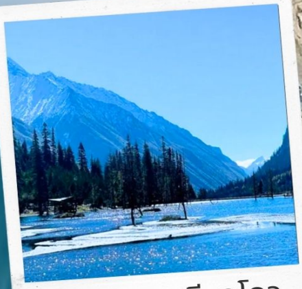
อุทยานชวงเจียวโกว