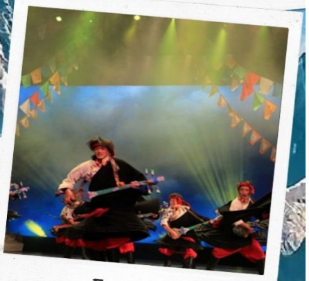
โชว์ทิเบต