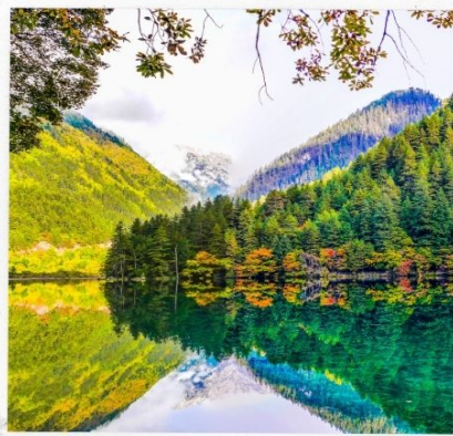
อุทยานจิ่วจ้ายโกว