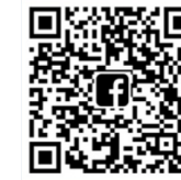
F: เทศบาลเมืองสะเตงนอก

สะเตงนอกก้าวหน้า การศึกษาเด่น เป็นเมืองน่าอยู่ สู่สังคมสันติสุข