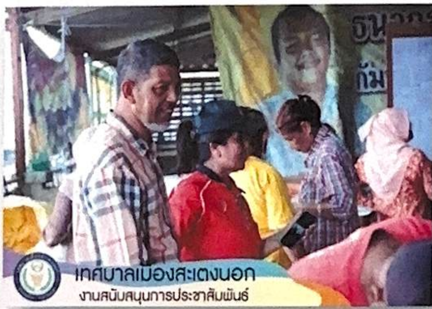
เทศบาลเมืองสะเตงนอก งานสนับสนุนการประชาสัมพันธ์