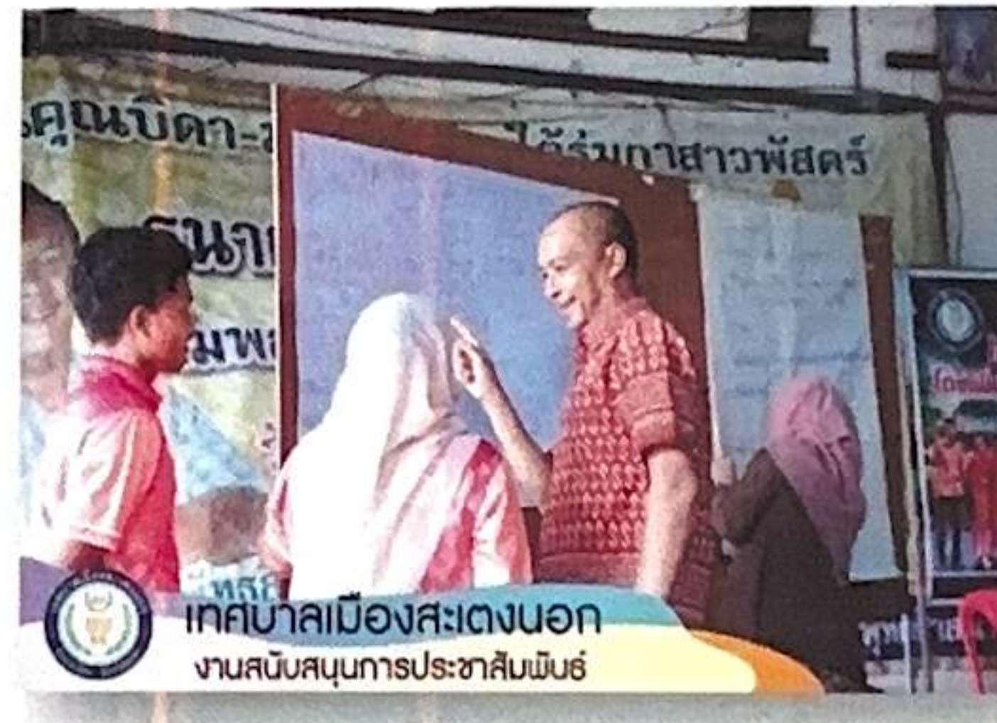
เทศบาลเมืองสะเตงนอก งานสนับสนุนการประชาสัมพันธ์