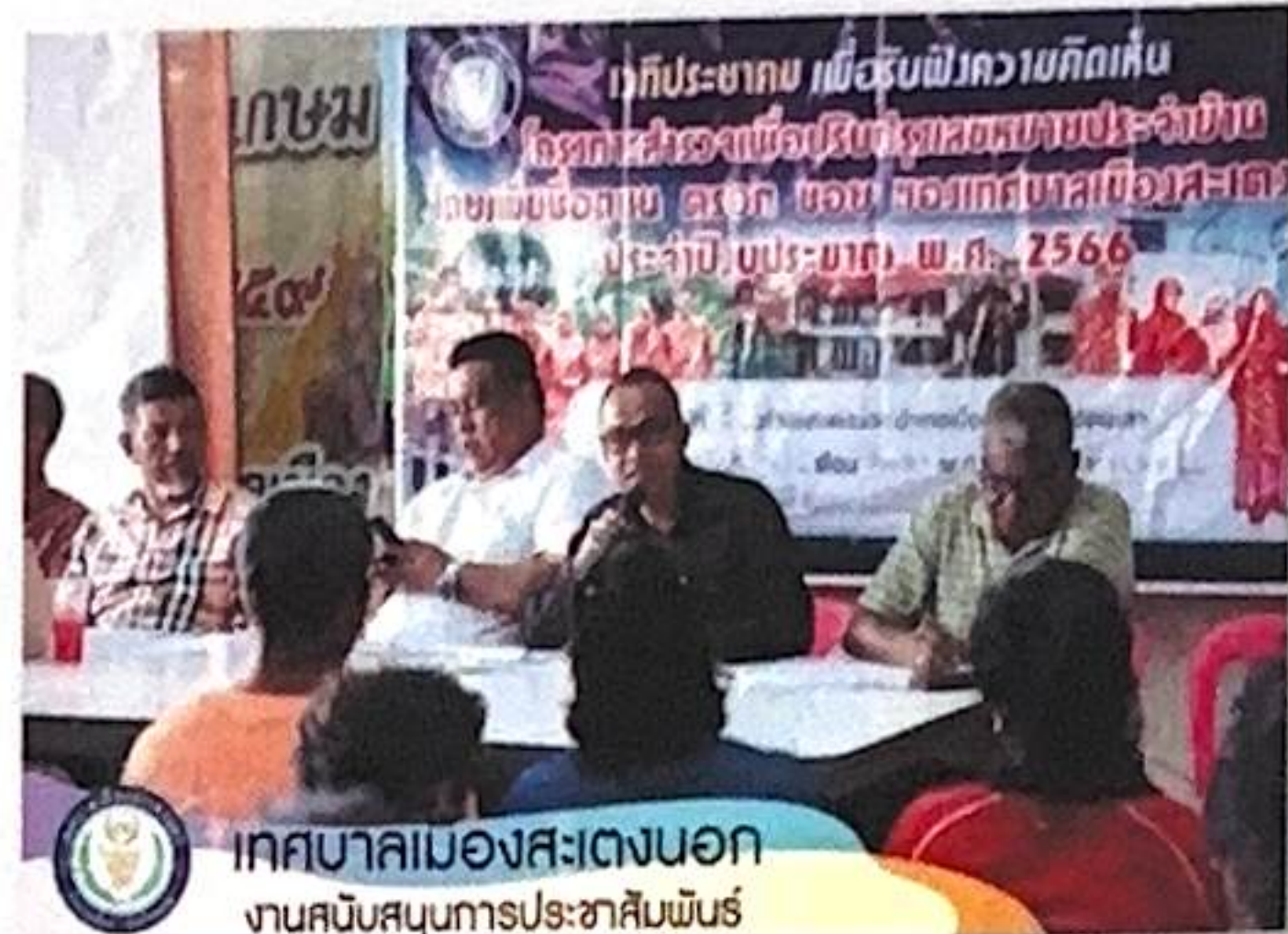
เทศบาลเมืองสะเตงนอก งานสนับสนุนการประชาสัมพันธ์