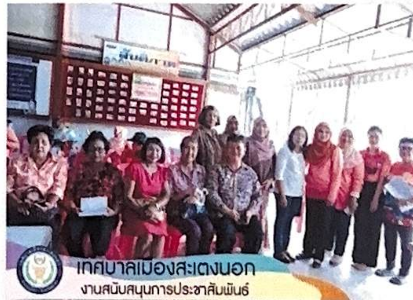
เทศบาลเมืองสะเตงนอก งานสนับสนุนการประชาสัมพันธ์