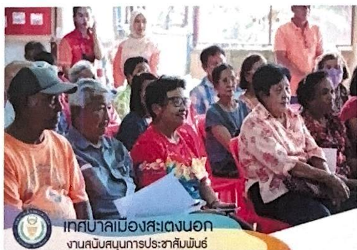
เทศบาลเมืองสะเตงนอก งานสนับสนุนการประชาสัมพันธ์