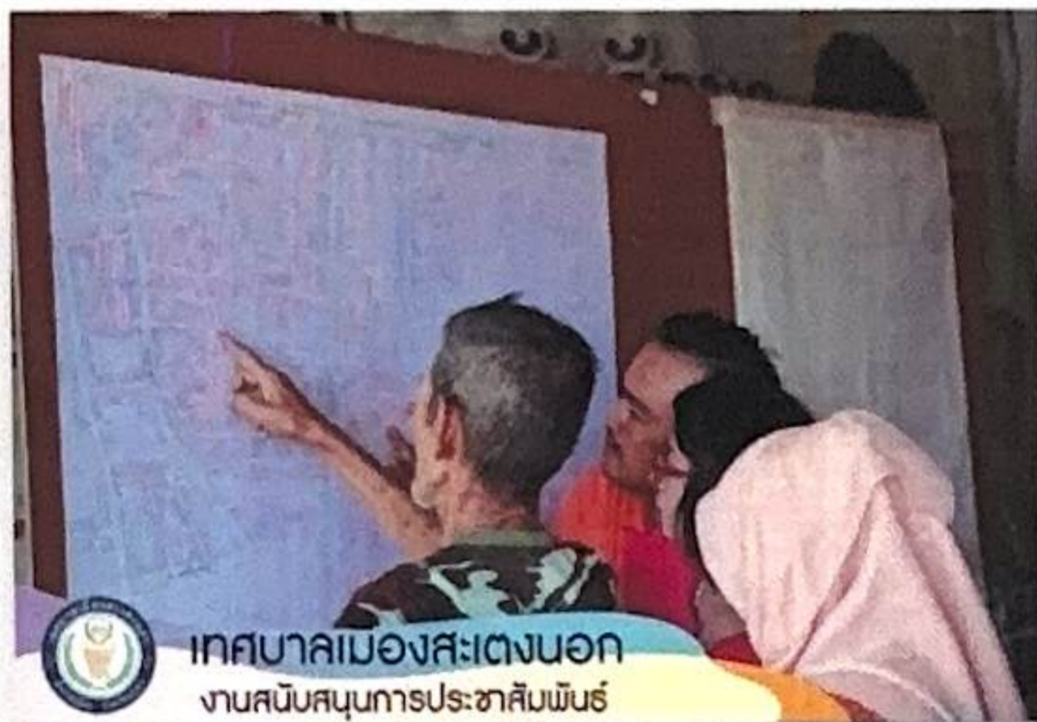
เทศบาลเมืองสะเตงนอก งานสนับสนุนการประชาสัมพันธ์