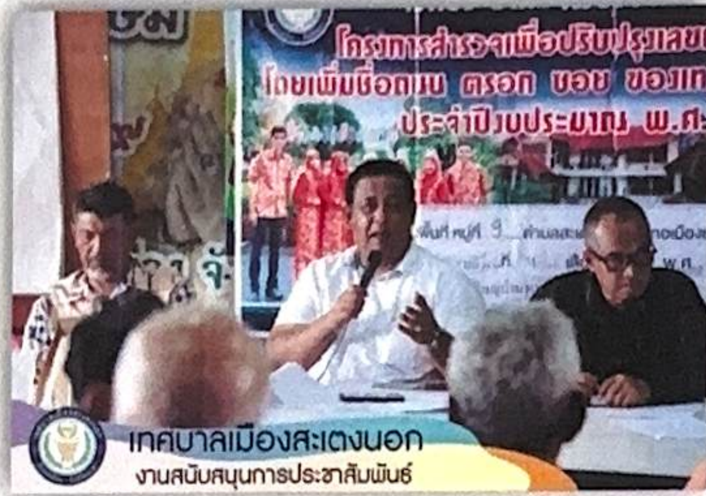
เทศบาลเมืองสะเตงนอก งานสนับสนุนการประชาสัมพันธ์

ภาพประกอบการจัดเวทีประชาคมเพื่อปรับปรุงเลขหมายประจำบ้าน เพิ่มชื่อถนน ตรอก ซอย ในทะเบียนบ้าน พื้นที่หมู่ที่ ๙ ตามโครงการสำรวจเพื่อปรับปรุงเลขหมายประจำบ้าน โดยเพิ่มชื่อถนน ตรอก ซอย ของเทศบาลเมืองสะเตงนอก ประจำปีงบประมาณ พ.ศ. ๒๕๖๖ เมื่อวันที่พฤหัสบดี ที่ ๓๑ สิงหาคม ๒๕๖๖