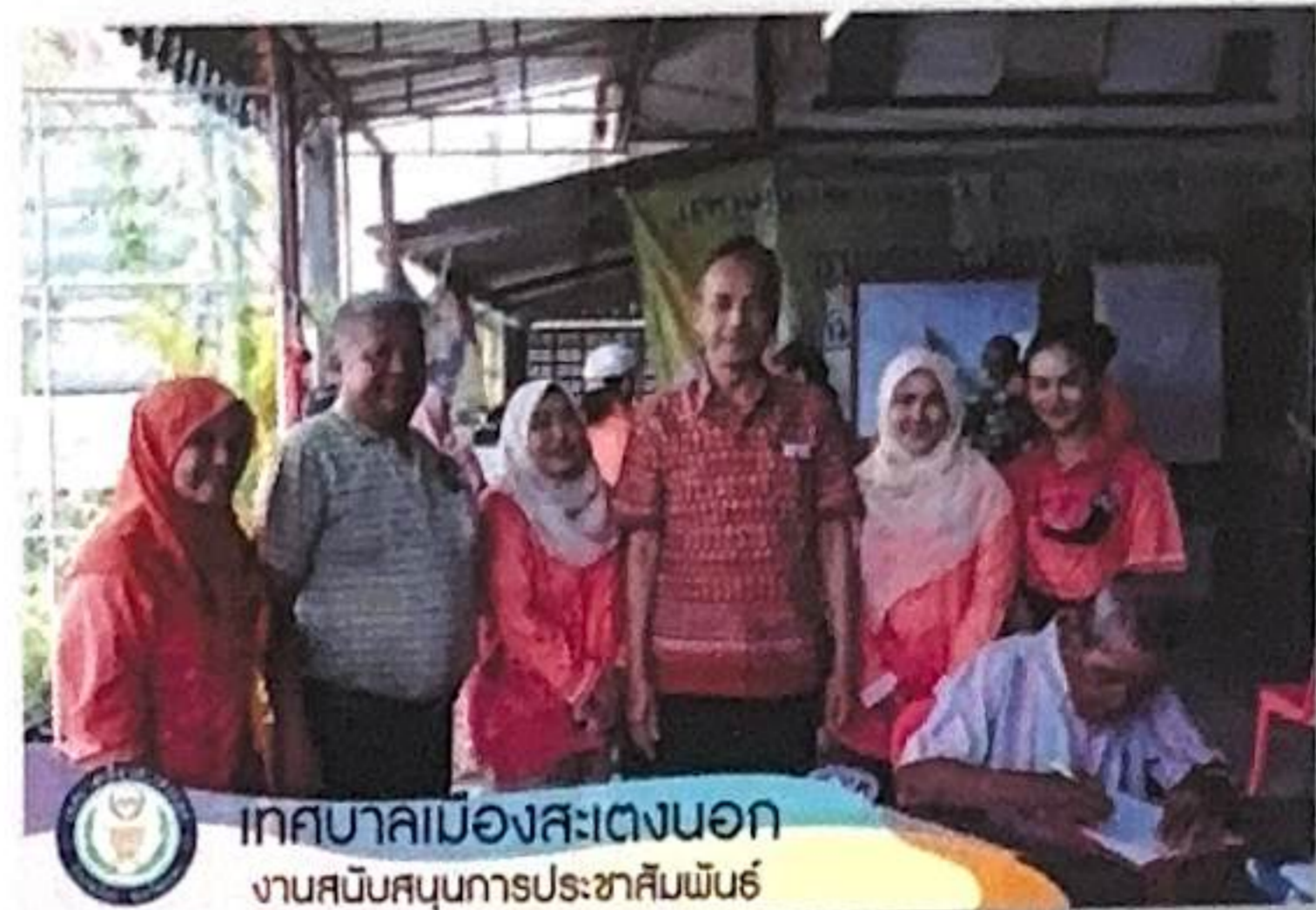
เทศบาลเมืองสะเตงนอก งานสนับสนุนการประชาสัมพันธ์