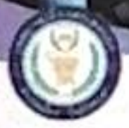
เทศบาลเมืองสะเตงนอก งานสนับสนุนการประชาสัมพันธ์