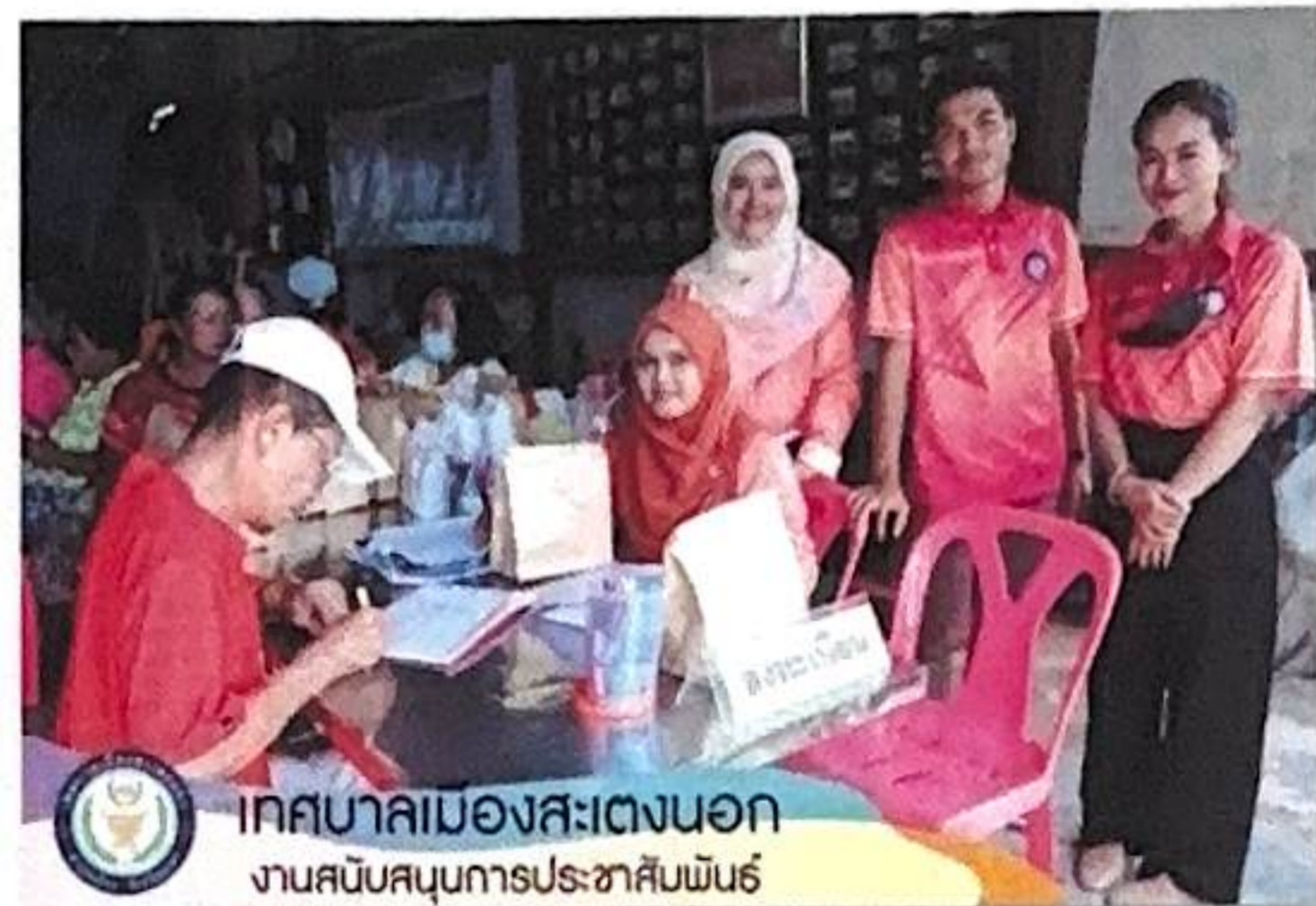
เทศบาลเมืองสะเตงนอก งานสนับสนุนการประชาสัมพันธ์