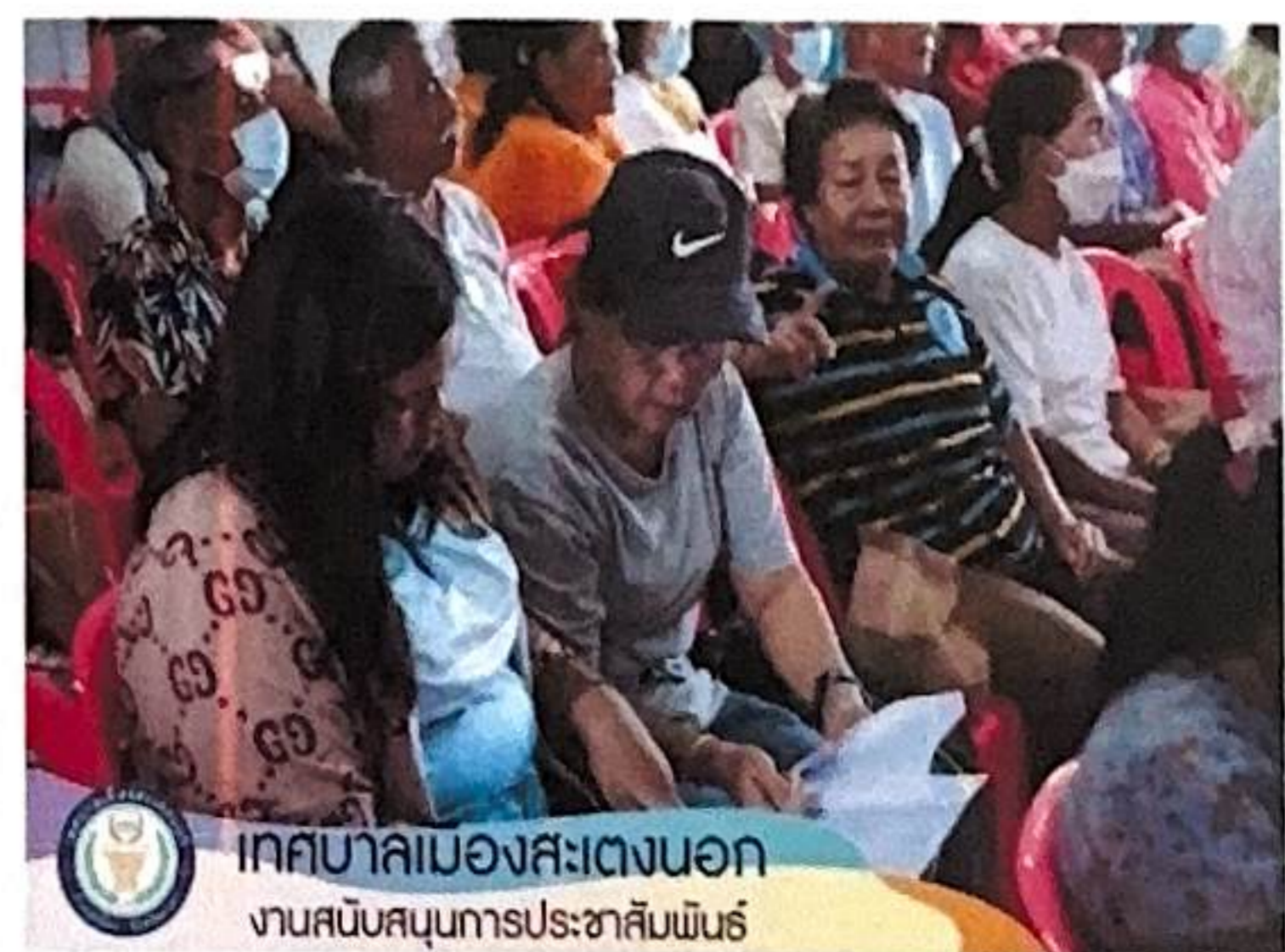
เทศบาลเมืองสะเตงนอก งานสนับสนุนการประชาสัมพันธ์