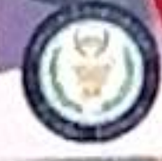
เทศบาลเมืองสะเตงนอก งานสนับสนุนการประชาสัมพันธ์