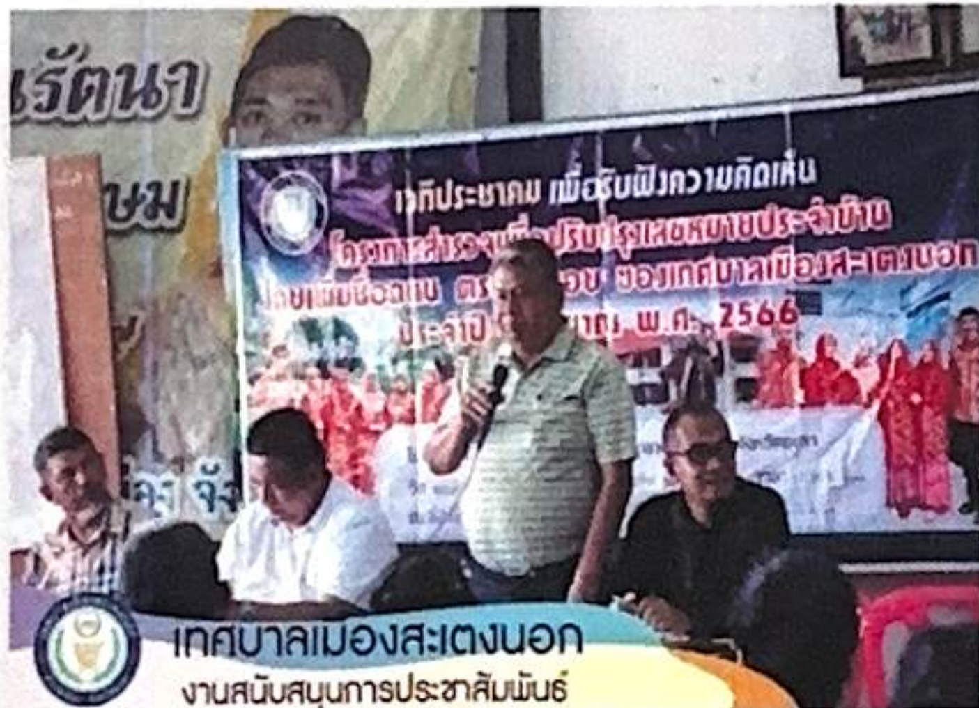
เทศบาลเมืองสะเตงนอก งานสนับสนุนการประชาสัมพันธ์