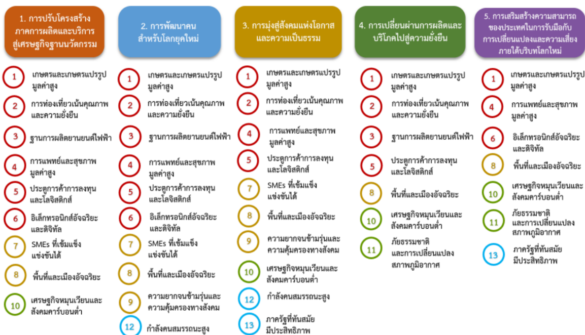
ภาพแสดงความเชื่อมโยงระหว่างหมุดหมายการพัฒนา กับเป้าหมายหลัก