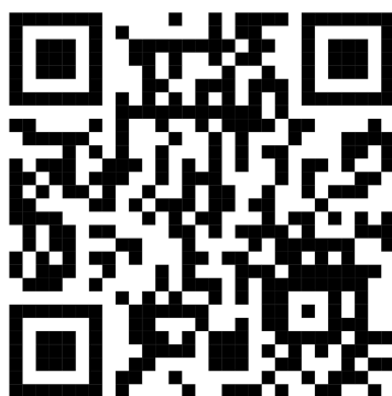
ภาพ QR Code

3. รายงานผลการดำเนินงานตามแผนงาน/โครงการ เมื่อดำเนินงานเสร็จสิ้น ผ่านระบบบริหารจัดการแผนปฏิบัติราชการ วิทยาลัยเทคนิคแพร่ (PTC Action Plan Platform)