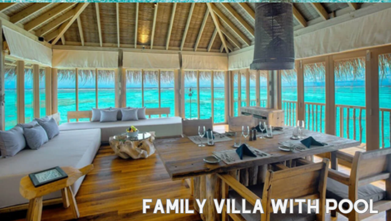
FAMILY VILLA WITH POOL