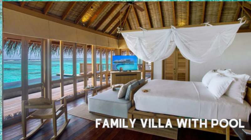
FAMILY VILLA WITH POOL