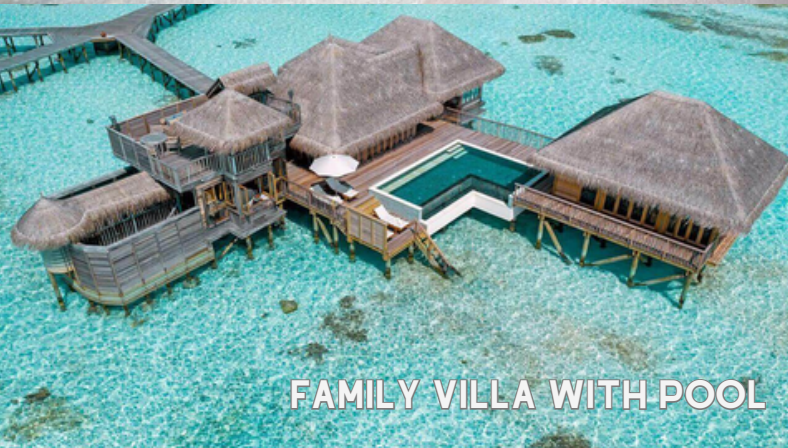
FAMILY VILLA WITH POOL