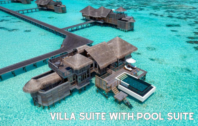
VILLA SUITE WITH POOL SUITE