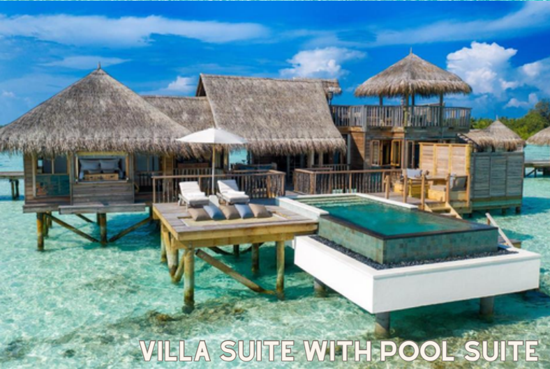
VILLA SUITE WITH POOL SUITE