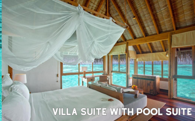
VILLA SUITE WITH POOL SUITE