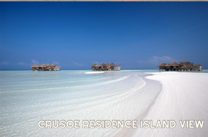
CRUSOE RESIDENCE ISLAND VIEW