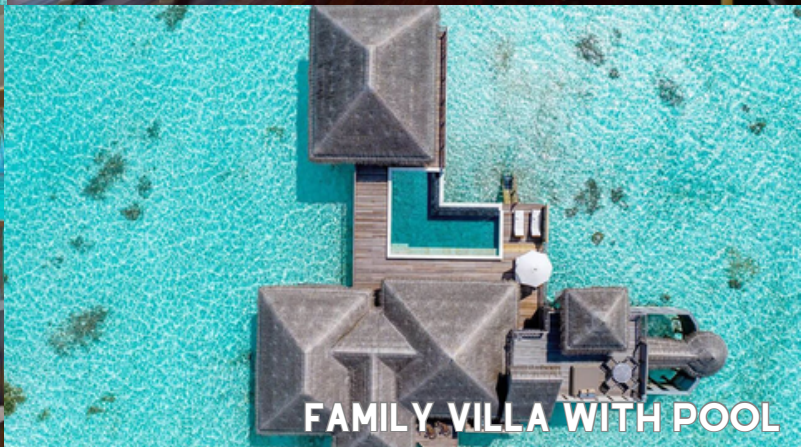
FAMILY VILLA WITH POOL