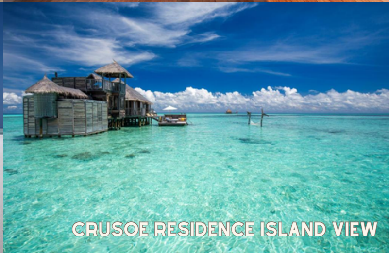
CRUSOE RESIDENCE ISLAND VIEW