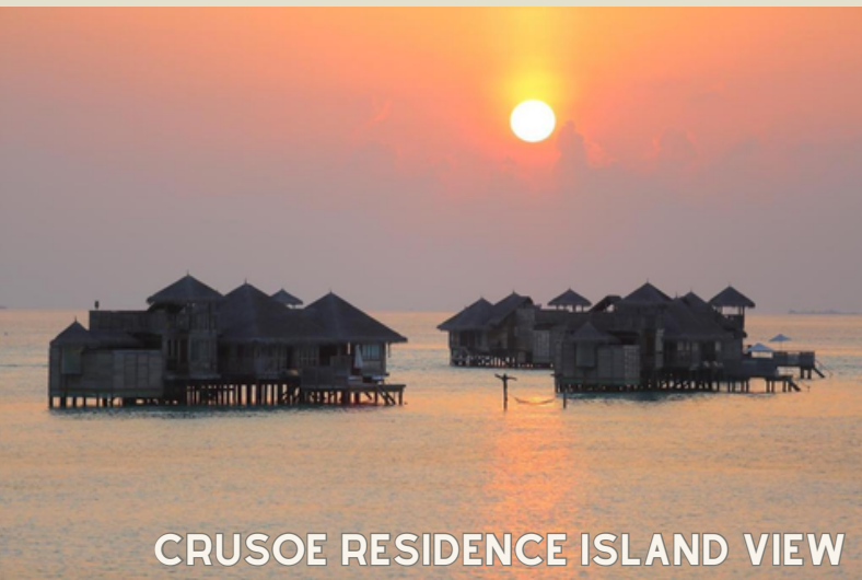
CRUSOE RESIDENCE ISLAND VIEW