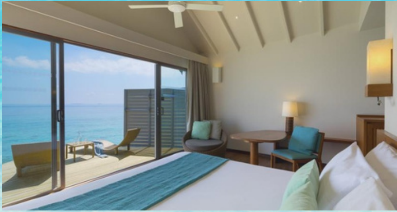
Room Type : Overwater Villa