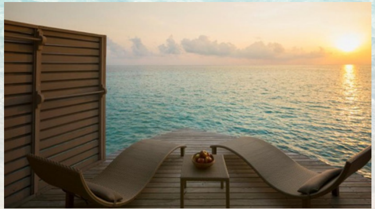
Room Type : Overwater Villa with Swirl Pool