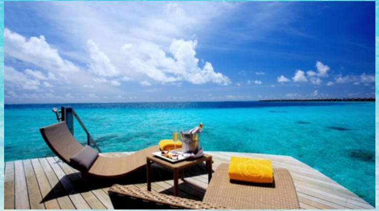
Room Type : Sunset Overwater Villa