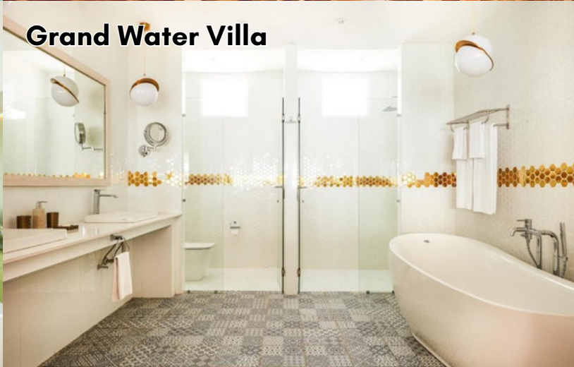
Grand Water Villa