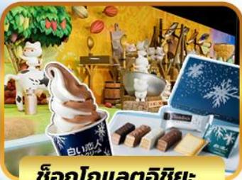
ช็อกโกแลตวิชิยะ