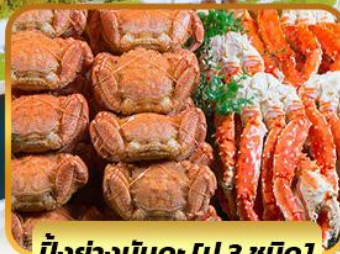
บึงย่างน้มนะ [ปู 3 ชนิด]