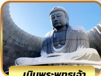
เนินพระพุทธรเจ้า