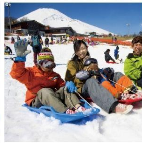
ลานสกีเยติ