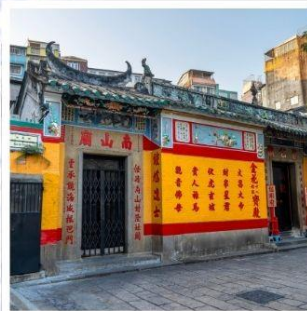
วัดเปากง