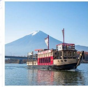
ล่องเรืออูปปะระะ