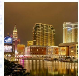
เดอะเวเนเซียน

ช้อปปิ้ง โกเทมบะฟรีเมียมเอ้าท์เล็ตส์ อย่างจุใจ เพลิดเพลินไปกับ กิจกรรมหิมะ บริเวณภูเขาไฟฟูจิ ล่องเรือชมความงามธรรมชาติใน ทะเลสาบคาวากุชิโกะ ชม เทศกาลประดับไฟ สุดอลังการ ณ หมู่บ้านเยอรมัน กราบไหว้ขอพรกับ เทพเจ้าองค์ไ้สวยเอี้ย วัดเปากง สัมผัสความอลังการของ เดอะเวเนเซียน รีสอร์ทระดับเวิลด์คลาส พักออนเซ็น 1 คืน!!! // อาหารพิเศษ... บุฟเฟ่ต์ซาบูยักซ์, เช็ก BBQ กรู๊ปสบายๆ เพียง 20 ท่านเท่านั้น!!!