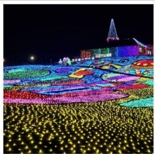
งานประดับไฟหมู่บ้านเยอรมัน