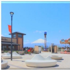
โกเทมบะฟรีเมียม เอ้าท์เล็ตส์